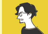
協力:イラストレーター いしい たつや氏