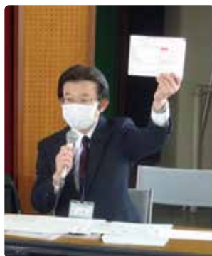
(新規採用職員説明会風景)