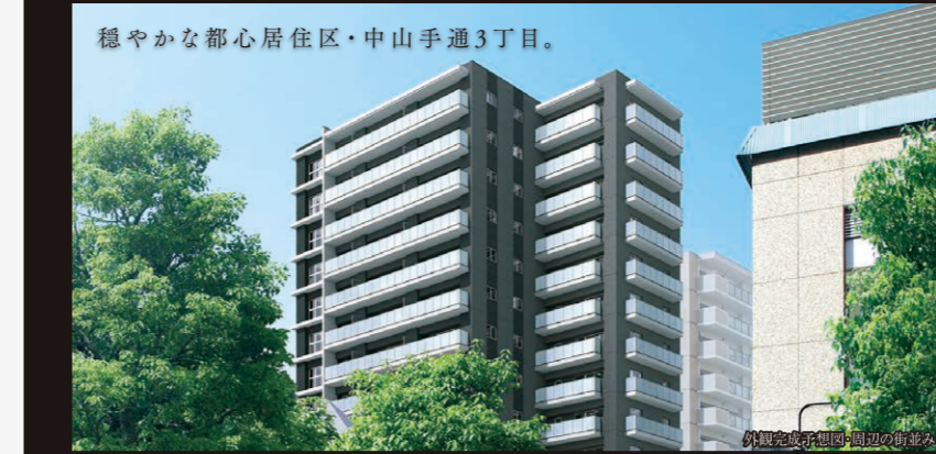
※掲載の外観完成予想図は現地付近から撮影(2023年7月)した周辺街並み写真・一部CG合成を施した上、完成予想図とCG合成したもので、位置・スケール・向き等、実際とは異なります。あらかじめご了承ください。